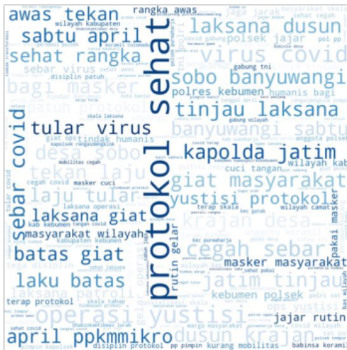
Gambar 20. Word Cloud Positif