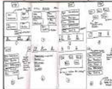
Gambar 4. 3 Hasil Brainstorming halaman beranda

halaman masuk akun, halaman OTP, halaman beranda, halaman layanan, halaman artikel, dan halaman akun. Hasil dari brainstorming dengan teknik crazy 8 proses pemanggilan petugas dapat dilihat pada gambar 4.3 dan untuk hasil brainstorming dengan teknik crazy 8 .