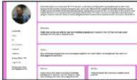
Gambar 4. 1 User Persona Tokoh Masyarakat Pelapor Keadaan Darurat

user persona . Pada penelitian terdapat dua kelompok atau kategori user persona yaitu tokoh masyarakat (Ketua RW, Ketua RT) dan petugas operator command center 112 Surabaya.