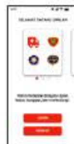
Gambar 4. 7 Prototype B Main page

Pada gambar 4.7 merupakan tampilan prototype B main page dari aplikasi panggilan darurat (PILAR). Pada tampilan prototype B main page terdapat kalimat ucapan selamat datang di aplikasi panggilan darurat (PILAR) dan slide image yang berisi image ikon Kota Surabaya, image logo aplikasi panggilan darurat (PILAR), image ikon kelima Layanan yang terdapat pada aplikasi panggilan darurat (PILAR). Lalu, terdapat visi misi dari aplikasi panggilan darurat (PILAR) dan dua button yakni button login dan button sign up yang berbentuk persegi panjang memiliki radius corner dengan tata letak sejajar vertikal ke bawah.