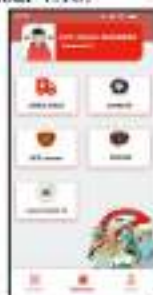
Gambar 4. 10 Halaman beranda

Pada tahapan akhir ini akan menghasilkan prototype C yang didapatkan dari tahap validate dengan pengujian antara dua prototype yakni prototype A dan prototype B kepada user yang telah dipilih. Prototype C dirancang dari feedback yang diberikan user ketika tahap validate . Hasil dari prototype C dapat dilihat pada gambar 4.10.