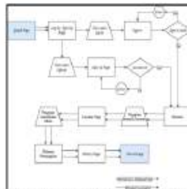
Gambar 3. 2 Userflow dari 4 Layanan yang sama

Aplikasi PILAR (Panggilan Darurat) adalah sebuah aplikasi layanan emergency berbasis android yang belum pernah ada di Indonesia dan dapat digunakan untuk melaporkan atau meminta penanganan saat terjadinya keadaan darurat seperti kecelakaan, kebakaran, bencana alam atau keadaan darurat yang memerlukan penanganan oleh petugas penanganan bencana. Aplikasi PILAR (Panggilan darurat) hanya dapat digunakan untuk wilayah Kota Surabaya dibawah naungan Command Center 112 Surabaya. Aplikasi PILAR difungsikan untuk user yang ingin melaporkan atau meminta penanganan dalam keadaan darurat kepada petugas. Pada aplikasi PILAR, pengguna diwajibkan mendaftar terlebih dahulu dengan data diri yang sesuai dengan KTP, username dan password , pengguna diwajibkan untuk upload foto KTP pengguna untuk menjamin bahwa pengguna tidak menyalahgunakan aplikasi PILAR. Bahasa yang digunakan pada aplikasi PILAR yaitu bahasa Indonesia. Setelah pengguna melakukan pendaftaran, pengguna dapat menggunakan layanan yang terdapat pada aplikasi PILAR seperti layanan Ambulance , layanan Pemadam Kebakaran, layanan Covid-19 , layanan BPB Linmas, dan layanan Dinas Perhubungan Surabaya.