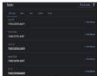
Gambar 4. 5 Font Roboto

Kemudian untuk jenis font yang dipakai pada kedua prototype yaitu "Roboto". Jenis font ini diterapkan pada kedua prototype karena paling mudah dibaca oleh mata manusia yang memiliki kerangka mekanis dan berbentuk geometris. Menurut google font , jenis ini memiliki sejumlah tipe style seperti thin , thin italic , light , light italic , regular , regular italic , medium , medium italic , bold , bold italic , black , black italic . Pada kedua prototype menggunakan "Roboto" dengan style regular dan bold yang dapat dilihat pada gambar 4.5.