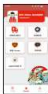
Gambar 4. 8 Prototype A halaman beranda

Pada gambar 4.8 merupakan tampilan prototype A halaman beranda dari aplikasi panggilan darurat (PILAR). Pada tampilan prototype A halaman beranda terdapat image announcement untuk memakai masker dan button dari kelima layanan aplikasi panggilan darurat terdapat ikon dan nama layanan, tata letak button kelima layanan ini dua baris kebawah dan sejajar kesamping. Pada bagian bawah terdapat navbar berisikan button halaman artikel, button halaman beranda, dan button halaman profil.