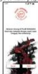
Gambar 4. 6 Prototype A Main page

Pada gambar 4.6 merupakan prototype A main page dari aplikasi panggilan darurat (PILAR). Pada tampilan prototype A main page terdapat logo aplikasi panggilan darurat (PILAR) sebagai identitas dari aplikasi ini agar pengguna mudah mengenal aplikasi panggilan darurat (PILAR). Lalu, terdapat dua button yang sejajar menyamping yakni button masuk dan button daftar dengan bentuk persegi panjang memiliki radius corner atau sisi melengkung. Background tampilan main page yakni ikon Kota Surabaya sebagai identitas asal atau daerah pengoperasian dari aplikasi panggilan darurat.