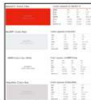
Gambar 4. 4 Color Scheme Prototype

Pada tahap prototype akan dirancang dua macam prototype yang berdasarkan storyboard pada tahap decide . Kedua macam prototype yakni prototype A dan prototype B yang akan dirancang menggunakan color scheme yang bisa dilihat pada gambar 4.4.