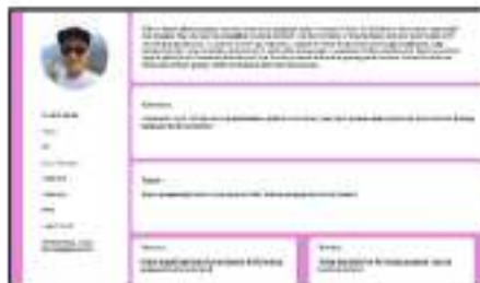
Gambar 4. 2 User Persona Petugas Operator Command Center 112 Surabaya

User persona pada gambar 4.2 dibawah adalah representasi dari kelompok user petugas. User persona pada gambar tersebut lebih fokus pada data demografi pengguna, kepribadian pengguna, kebutuhan, tujuan, motivasi dan kendala dari kelompok user petugas. Karakter pada gambar dibuat untuk mewakili jenis user yang menggunakan aplikasi panggilan darurat ini.