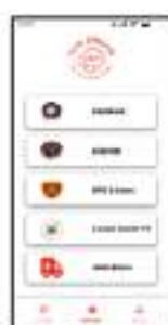
Gambar 4. 9 Prototype B halaman beranda

Pada gambar 4.9 merupakan tampilan prototype B halaman beranda dari aplikasi panggilan darurat (PILAR). Pada tampilan prototype B halaman beranda terdapat logo aplikasi panggilan darurat dengan tata letak tengah atas dan terdapat button kelima layanan aplikasi panggilan darurat yang berisi ikon dan nama layanan dengan tata letak button sejajar vertikal kebawah. Pada bagian bawah terdapat navbar berisikan button halaman artikel, button halaman beranda, dan button halaman profil.