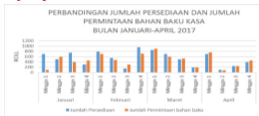
Gambar 1. Grafik Jumlah Persediaan dan Jumlah permintaan Bahan Baku

Proses produksi pada perusahaan sering mengalami keterhambatan, ada dua faktor yang menyebabkan terhambatnya proses produksi yaitu pada saat pengadaan bahan baku, terjadi keterlambatan penerimaan bahan baku dari pemasok sehingga perusahaan harus menunggu bahan baku tersebut datang untuk selanjutnya dilakukan proses produksi. Karena waktu tunggu bahan baku dari pemasok umumnya tiga hari maka membuat perusahaan mengalami kerugian waktu dan finansial. Dalam sebulan keterlambatan penerimaan bahan baku bisa terjadi dua sampai tiga kali dalam sebulan, berdasarkan dari hasil wawancara kepada Bapak Ade selaku manajer administrasi & umum. [25] Faktor permintaan bahan baku dari bagian produksi ke bagian gudang yang sering terjadi kekurangan bahan baku sehingga perusahaan harus menunda waktu produksi sebelum dilakukannya proses pengadaan bahan baku. Hal tersebut di sebabkan karena perusahaan tidak memiliki proses pengendalian bahan baku secara khusus. [25] Berikut merupakan grafik perbandingan jumlah persediaan bahan baku kasa hidrofil steril di gudang dan jumlah permintaan bahan baku dari bagian produksi.