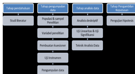
Gambar 1. Tahap-Tahap Dalam Metode Penelitian

Peneliti menggunakan metode untuk penyelesaian permasalahan pada Tugas Akhir ini secara garis besar dilakukan melalui 4 tahap, seperti pada gambar 1.