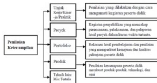
Gambar 9. Skema Penilaian Keterampilan

Menurut Kemendikbud (2015), Penilaian keterampilan dibagi dalam empat kategori, antara lain penilaian praktik/kinerja, penilaian proyek, penilaian produk dan penilaian portofolio. Instrumen yang digunakan dalam menilai keterampilan siswa berupa daftar cek atau skala penilaian (rating scale) yang dilengkapi rubric penilaian. Skema penilaian keterampilan dapat dilihat pada gambar 9 berikut: