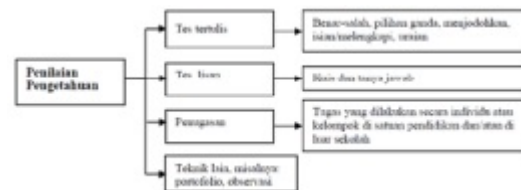
Gambar 5. Skema Penilaian Pengetahuan

Menurut Kemendikbud (2015), berbagai teknik penilaian pengetahuan atau akademis dapat digunakan dan disesuaikan dengan kompetensi dasar. Teknik penilaian pengetahuan atau akademis yang banyak dilakukan adalah tes tertulis, tes lisan, dan penugasan. Skema penilaian pengetahuan dapat dilihat pada gambar berikut: