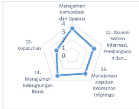
Gambar 4 Jaring Laba-laba Nilai Maturity Level Keseluruhan klausul