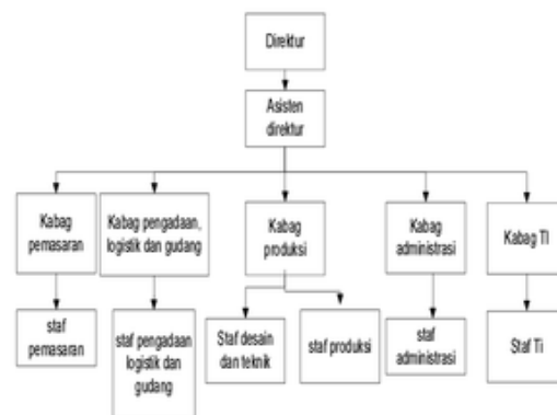
Gambar 3 Usulan perubahan struktur organisasi