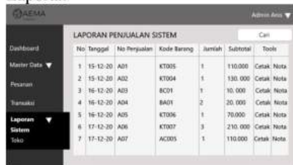
Gambar 14 Laporan

Halaman laporan penjualan ini berisi tabel yang isinya terdapat no, tanggal, no penjualan, kode barang, jumlah, subtotal dari semua transaksi melalui distem dan tools untuk cetak untuk mencetak nota, tools nota untuk melihat nota. Kolom cari untuk mencari laporan dengan cepat