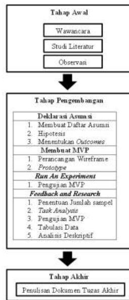
Gambar 1 Tahapan Metodologi Penelitian