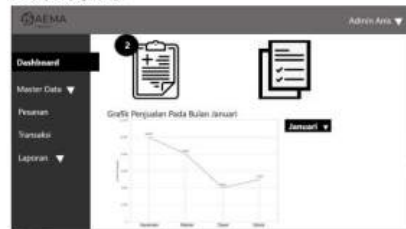
Gambar 9 Dashboard

Halaman login admin ini akan muncul jika sudah berhasil login, Pada login terdapat notifikasi pesan yang masuk, halaman laporan untuk dapat melihat dengan cepat laporan penjualan, grafik penjualan untuk mengetahui penjualan dari masing masing jenis produk di setiap bulannya.