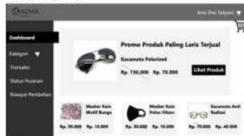
Gambar 2 Dashboard

Pada dashboard berisi produk produk yang sedang promo dan yang terlaris dan juga terdapat button lihat produk untuk melihat detail dari produk tersebut.