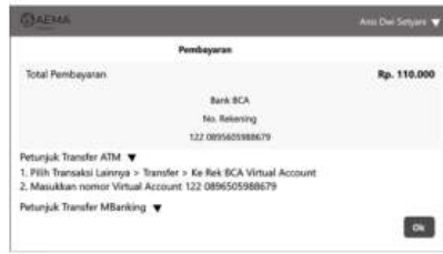
Gambar 6 Pembayaran

Pada halaman ini terdapat informasi mengenai no rekening dan total pembayaran, dan juga petunjuk pembayaran.