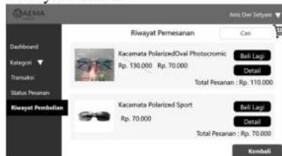
Gambar 8 Riwayat Pesanan

Halaman riwayat pembelian ini berisi list produk yang sudah pernah dipesan, kolom cari untuk mencari pesanan dengan cepat, button beli lagi untuk membeli lagi produk yang sudah pernah dipesan, button detail untuk melihat detail pesanan yang sudah pernah dipesan