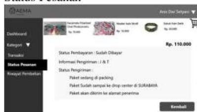
Gambar 7 Status Pesanan

Halaman status pesanan ini berisi list produk yang sedang dipesan beserta informasi mengenai status pembayaran, informasi pengiriman, status pengiriman yang berisi lokasi paket berada.