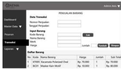
Gambar 12 Transaksi

Halaman pesanan ini berisi kolom untuk menginputkan produk yang dibeli oleh customer di toko, button cek untuk mencari kode barang yang otomatis akan mengisi detail barang tersebut (nama, merk harga barang), tabel daftar barang yang berisi produk yang akan dibeli, button tambah untuk menambahkan produk, button simpan untuk menyimpan laporan penjualan.