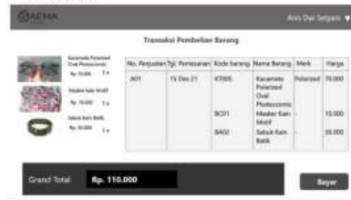
Gambar 5 Transaksi

Halaman transaksi pembelian ini akan muncul jika menekan button beli pada halaman detail produk ataupun keranjang, pada halaman ini terdapat tabel yang isinya list barang yang dipilih untuk dibeli beserta keterangan dari masing masing produk.