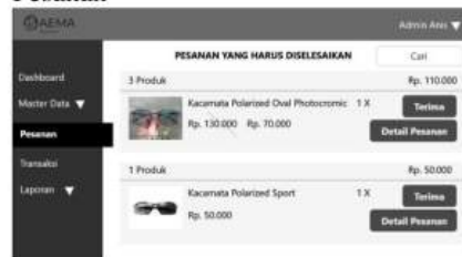
Gambar 11 Pesanan

Halaman pesanan ini berisi list pesanan masuk dari sistem, kolom cari untuk mencari pesanan dengan cepat, button terima untuk menerima pesanan dan mulai dilakukan packing, button detail pesanan untuk melihat secara detail pesannya.