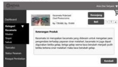
Gambar 4 Detail Produk

Halaman detail produk ini akan muncul jika menekan salah satu produk, pada halaman ini terdapat keterangan produk yang dipilih.