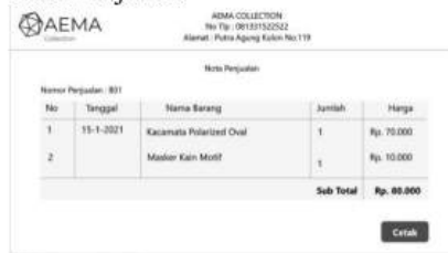
Gambar 13 Nota Penjualan

Halaman nota penjualan akan muncul jika transaksi selesai, halaman ini berisi tabel penjualan detail dengan tanggal, nama barang, jumlah, dan harga, button cetak untuk print nota.