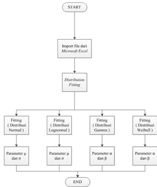
Gambar 2 Diagram desain penelitian

Setelah menghitung MSE maka akan keluar nilai eror terkecil yang nantinya digunakan sebagai patokan pendekatan ke semua distribusi yang digunakan. Sebagai contoh jika nilai MSE dari distribusi no rmal lebih kecil daripada ketiga MSE distribusi lainnya, maka yang digunakan adalah distrbusi normal. Diagram langkah-langkah penelitian secara detail ditunjukkan dalam gambar 2