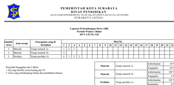
Gambar 5. Laporan Perkembangan Siswa

Setelah tahap pembahasan aplikasi, Berikutnya membahas tentang testing . Testing yang dilakukan menghasilkan dua uji coba yaitu uji coba aplikasi dengan black box dan white box . Berdasarkan hasil uji coba aplikasi menggunakan black box dan white box testing aplikasi ini layak untuk digunakan dan aplikasi ini dapat diterima oleh perusahaan.