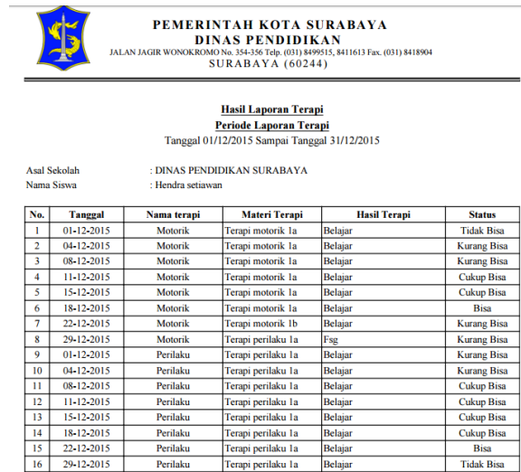
Gambar 4. Laporan Terapi Siswa

menampilkan form perkembangan berdasarkan filter nama guru, bulan dan tahun. Halaman selanjutnya menampilkan grafik batang perkembangan siswa bila pengguna ingin mencetak laporan perkembangan pengguna menekan cetak untuk mencetak laporan perkembangan.