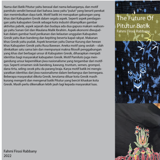
Gambar 4.13 Halaman Cover dan Back Cover

Pada halaman cover buku disini menggunakan jenis layout picture window dengan menampilkan hasil foto dari salah satu hasil dari motif campuran, yaitu : Rusa Bawean, Pudak, Gapuro Sunan Giri, Ikan Bandeng, dan Damar Kurung. Lalu font yang digunakan adalah tipe font : Myriad Pro.