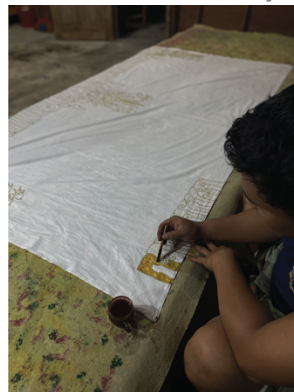
Gambar 4.17 Halaman Isi

Pada halaman – halaman isi menggunakan jenis layout picture window , yang menampilkan gambar proses dimulai nya pembuatan kain