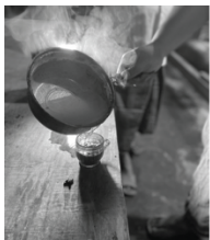
4 Dibuat juga sebagai proses pemberian warna pada motif kain batik.