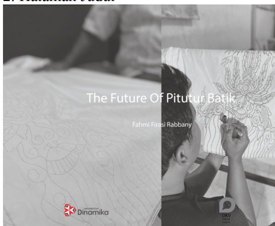
Gambar 4.14 Halaman Judul Buku

Pada halaman judul disini menggunakan warna grey yang telah di opacity ke 25% sehingga gambar foto yang ditampilkan masih tidak tertutup, dan menggunakan space yang luas agar terlihat lebih rapi.