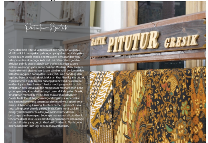
Gambar 4.16 Halaman Kata Pengantar