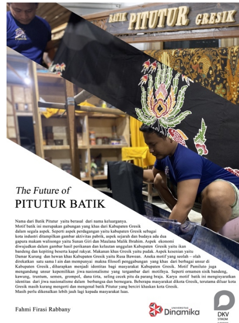
Gambar 4.20 Desain Poster

Poster bertujuan untuk menampilkan foto dari beberapa kegiatan membatik beserta kondisi latar belakang tempat untuk produksi selembur kain batik yang bertempat di bagian paling atas dengan menggunakan Layout Mondrian .