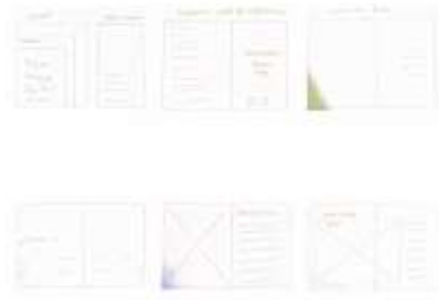
Gambar 4.4 Sketsa Media Utama

Dalam proses sketsa dilakukan pembuatan layout cover sampai dengan isi dari buku tersebut. Konsep yang digunakan yakni “ Valuable ”, Kata tersebut dipilih karena memiliki arti sesuatu yang bernilai, berguna atau memiliki manfaat yang menggambarkan nilai sejarah yang kuat dan manfaat sebagai busana dengan berbagai variasi Tenun Gedog yang khas.