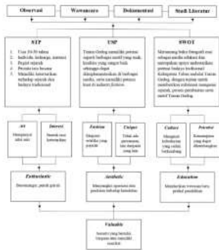
Gambar 4.1 Keyword