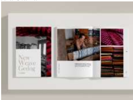
Gambar 4.6 Buku Fotografi

Media utama yang menjadi penunjang perancangan ini adalah buku fotografi esai dimana yang berisi tentang sejarah tenun gedog, proses pembuatan tenun gedog, motif tenun gedog serta mengikat budaya dan busana sehingga dapat dikombinasikan sehelai tenun dengan busana agar terlihat formal.