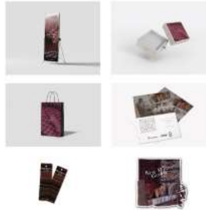
Gambar 4.7 Media Pendukung

Media pendukung yang digunakan adalah x-banner, pembatas buku, packaging box, paper bag, stiker dan poster. Hal tersebut dapat menunjang untuk melestarikan Tenun Gedog Tuban.