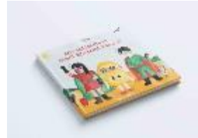
Gambar 4. 6 Media Utama

Media buku ini memiliki keunggulan informasi didalamnya dan dengan disajikan visual berupa ilustrasi watercolor sesuai dengan konsep yang telah dirancang dan dengan target pembaca yaitu anak usia 6-12 tahun.. Maka ukuran yang diterapkan pada buku ini yaitu 20cm x 22 cm. Untuk finishing menggunakan cetak hardcover dengan laminasi doff.