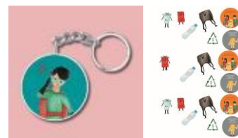
Gambar 4. 12 Desain Gantungan Kunci dan Stiker

Gantungan kunci berfungsi sebagai penanda kunci atau barang lainnya agar mudah ditemukan. Implementasi desain yang digunakan dengan objek visual salah satu super hero dan Warna yang digunakan sesuai dengan warna energetic . Berbentuk lingkaran dengan ukuran diameter 5,8 cm. Sedangkan stiker dapat ditempel dimana mana. Untuk desain stiker visualisasinya dari karakter monster plastik, simbol kode plastik dan beberapa karakter super hero. Ukuran yang digunakan pun bermacam-macam.