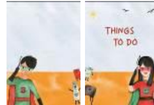
Gambar 4.11 Desain Notebook

Notebook ini juga dapat digunakan sehari-hari, untuk menulis atau mencatat sesuatu. Implementasi desain yang digunakan tetap dengan objek visual dua orang super hero dan beberapa monster plastik. Ukuran yang digunakan yaitu A5 dan menggunakan finishing spiral untuk memudahkan membuka.