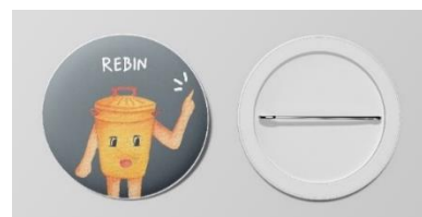
Gambar 4. 13 Desain Pin