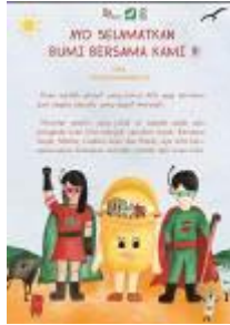
Gambar 4.14 Desain Poster

Desain poster didesain dengan bentuk yang simple, lalu terdapat headline dan bodytext yang mudah dibaca oleh pembaca terutama anak-anak. Dalam poster ini ada tokoh Super Waste, Captain Lees dan Rebin. Selain itu, juga terdapat monster-monster plastik kecil untuk menggambarkan bahwa monster plastik ini adalah musuh dari ketiga super hero dan harus segera dihilangkan. Ukuran poster yang dicetak adalah ukuran A3. Warna yang digunakan sesuai dengan warna yang sudah ditentukan sebelumnya yaitu warna " Energetic "