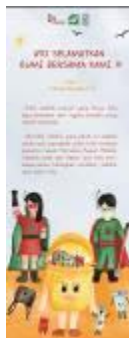
Gambar 4. 9 Desain X-banner

X-banner ini digunakan sebagai penanda bahwa adanya event atau pameran yang berupa stand. Implementasi desain yang digunakan sama dengan poster dan warna yang digunakan sesuai dengan warna energetic. Ukuran yang digunakan adalah 160 cm x 60 cm.