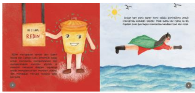
Gambar 4. 8 Desain Isi Buku

Dalam desain layout halaman 3 msaih merupakan halaman perkenalan dengan menunjukkan karakter Rebin yang sedang memegang papan gantung yang terdapat nama dirinya, lalu dibawahnya terdapat penjelasan mengenai karakter. Background yang digunakan menggunakan warna merah polos.Sedangkan pada desain layout halaman 4 menggambarkan Captain Lees sedang terbang diatas laut untuk memantau keadaan sekitar. Latar tempat berada di laut dengan suasana yang cerah.