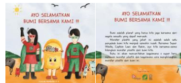
Gambar 4. 7 Desain Cover depan&belakang

Desain pada cover depan memperlihatkan 3 karakter utama yaitu Super Waste, Captain Lees dan Rebin yang dipenuhi dengan monster plastik. Juga terdapat monster-monster plasti kecil dibagian samping dan bawah. Penempatan judul "Ayo Selamatkan Bumi Bersama Kami !!!" berada di sisi tengah bagian atas agar lebih terlihat jelas. Sedangkan desain cover belakang hanya menampilkan 2 monster plastik disisi samping kanan dan kiri buku dengan latar belakang tempat disuatu halaman. Lalu penempatan judul berada di bagian tengah atas dan dibawahnya terdapat synopsis dari isi buku. Pemilihan desain yang simple untuk lebih memudahkan membaca sinopsisnya.