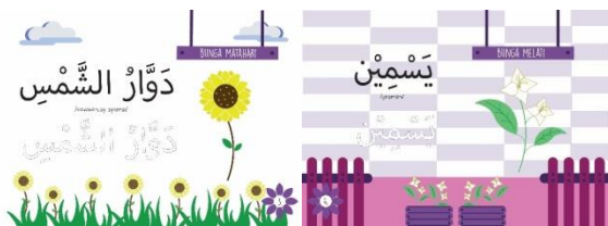
Gambar 4.6 Desain Isi Buku Aktivitas

Desain halaman konten terdapat bunga matahari di tengah agar tidak bosan dan bervariasi. Untuk warna dan font sesuai keyword playful . Untuk background tergantung konten yang dibahas, apabila konten yang dibahas tentang bunga matahari maka backgroundnya harus sesuai dengan bunga matahari.