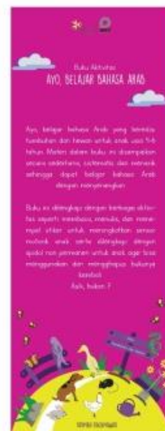
Gambar 4.9 Desain X-Banner