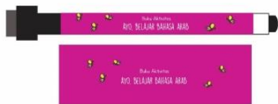
Gambar 4.10 Desain Spidol

Desain spidol menyesuaikan dengan ukuran spidol. Desain nya menggunakan stiker yang bertuliskan buku aktivitas “Ayo, belajar Bahasa Arab” lalu diberi gambar kupu-kupu yang diambil dari ilustrasi cover buku agar terlihat lebih menarik.