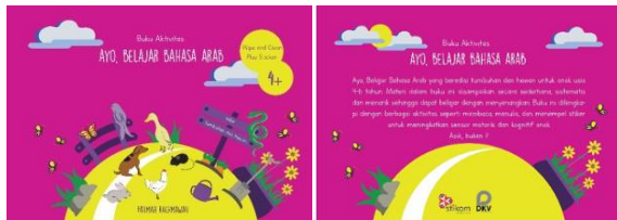
Gambar 4.5 Desain Cover Depan dan Belakang Buku Aktvitas