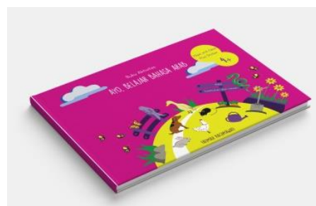
Gambar 4.4 Media Utama Buku Aktivitas

Pemilihan media utama buku aktivitas dalam perancangan ini karena kurangnya media pembelajaran bahasa Arab untuk anak TK usia 4-6 tahun. Dengan ukuran buku 14,8 x 21,0 cm menggunakan jenis kertas ivory 210 gram. Untuk Finishing jilid hardcover.