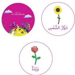
Gambar 4.11 Desain Pin

Desain pin dan stiker diperoleh dari ilustrasi gambar hewan dan tumbuhan. Untuk desain pin yang utama diambil dari ilustrasi cover depan buku, terus pin yang kedua atau ketiga diambil dari ilustrasi tumbuhan seperti bunga matahari dan anggrek. Bahan dari pin terbuat dari plastik berbentuk lingkaran dengan ukuran berdiameter 5,8 cm dengan laminasi doff.