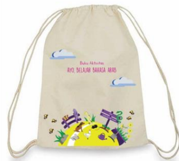
Gambar 4.8 Desain Drawstring Bag