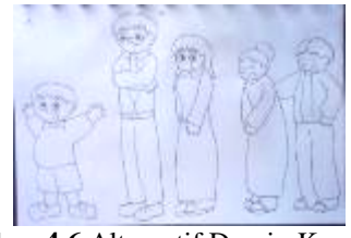
Gambar 4.6 Alternatif Desain Karakter 1

Dari 4 alternatif desain yang telah dibuat, desain kemudian ditunjukkan pada anak-anak usia 6-9 tahun untuk ditanyai pendapatnya tentang gaya ilustrasi mana yang paling mereka sukai. Hasilnya, 61% anak memilih gaya ilustrasi gambar 4.9, 26% anak memilih gaya ilustrasi gambar 4.7, 10% memilih gaya ilustrasi gambar 4.8 dan 3% memilih gaya ilustrasi gambar 4.10. Sehingga dipilihlah gaya ilustrasi gambar 4.10 sebagai desain karakter tokoh cerita. Sketsa terpilih kemudian dibawa ke ranah digital dan didesain sebagai berikut: