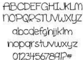
Gambar 4.2 Font Cinnamon Cake

Untuk isi cerita, font yang digunakan yakni font Cinnamon Cake. Font ini memiliki karakter yang playful karena bentuknya yang tidak rapi sehingga sesuai dengan karakteristik anak. Font ini juga memiliki ketebalan yang tidak terlalu tebal sehingga tidak akan mengganggu fokus ilustrasi dalam buku cerita.