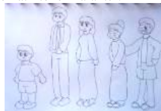
Gambar 4.3 Alternatif Desain Karakter 1

Karakter tokoh dalam cerita bergambar ini ada 5 orang yakni Dika, Mama, Papa, Kakek Aldi dan Nenek Dian. Desain karakter dibuat selucu mungkin dan telah disesuaikan agar dapat menarik minat anak usia 6-9 tahun. Berikut sketsa alternatif tokoh karakter: