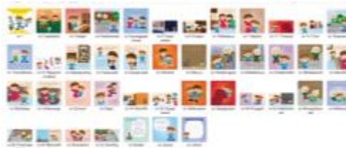
Gambar 4.13 Isi Buku

Di akhir buku, akan ada kesimpulan pesan moral cerita berupa halaman pesan untuk anak yang berisi nasehat untuk melakukan tindakan positif apapun yang sedang terjadi.