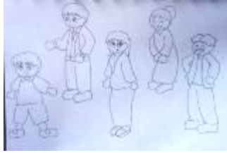
Gambar 4.4 Alternatif Desain Karakter 2