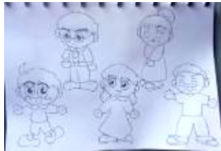
Gambar 4.5 Alternatif Desain Karakter 3