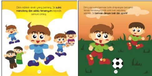
Gambar 4.11 Halaman 1 dan Halaman 2

Pada halaman depan, terdapat judul, nama penulis serta keterangan bahwa buku harus dibaca bersama orang tua. Tujuannya agar menjelaskan pada audiens bahwa buku tersebut tidak bisa dibaca sendirian oleh sang anak