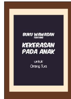
Gambar 4.14 Cover Buku Panduan

Buku panduan untuk orang tua memiliki warna yang selaras dengan buku cerita. Desain yang simpel merepresentasikan maksud buku yang langsung to-the-point . Namun, isi akan memiliki warna yang berbeda di setiap jenis pembahasan. Hal ini bertujuan untuk membedakan sehingga memudahkan pembaca untuk mengingat setiap jenis kekerasan tersebut.