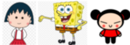
Gambar 4.9 Beberapa Karakter Tokoh dengan Rona Pipi

Karakter Dika memiliki sifat yang kuat, tegar, ceria, selalu ingin tahu, pintar dan sportif. Karakter Dika digambarkan sebagai karakter anak idaman yang memiliki sifat positif secara garis besar. Penggambaran Dika yang positif diharapkan akan menjadi motivasi untuk anak agar berperilaku baik terlepas dari bagaimanapun kondisi yang sedang ia hadapi. Dika memakai baju berwarna biru yang memiliki arti tenang, meningkatkan kepercayaan diri dan menurunkan kecemasan sesuai dengan sikap yang dibangun oleh Dika. Rambut yang bergelombang dengan poni yang tidak rata melambangkan karakter Dika yang masih suka bermain dan bebas karena tidak terlalu memperhatikan kerapian. Pipi Dika yang merona merah melambangkan karakter anak kecil yang periang, muda, dan lembut. Beberapa karakter kartun anak juga menggunakan rona pipi yang jelas agar terlihat lebih menarik.