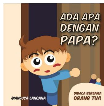
Gambar 4.10 Front Cover