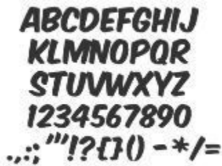
Gambar 4.1 Font Komika