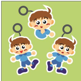
Gambar 4.17 Desain Gantungan Kunci

Gantungan kunci akan menggunakan desain karakter utama, Dika, dengan varian ekspresi yang berbeda. Ekspresi yang digunakan hanya dibatasi 3 jenis yakni, separuh badan, ekspresi ceria, dan ekspresi penasaran.