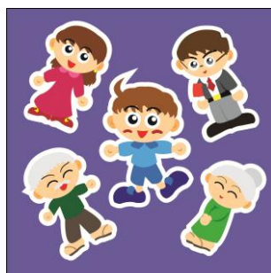
Gambar 4.18 Desain Stiker

Stiker akan direalisasikan dengan karakter yang ada dalam cerita yakni, Dika, Mama, Papa, Kakek Aldi dan Nenek Dian. Stiker akan menggunakan laminasi glossy agar terlihat berkilau dan menarik mata.