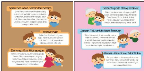
Gambar 4.12 Halaman Pesan

Penggunaan background berwarna pastel bergradasi, ditujukan untuk menekankan emosi yang sedang dibangun dan menonjolkan karakter cerita. Kata-kata yang mengarah positif seperti suka menolong dan selalu tersenyum akan ditebali agar memberikan kesan tersendiri pada anak saat membacanya. Ini juga bertujuan untuk menanamkan kalimat positif dalam benak anak karena adanya penekanan disitu.