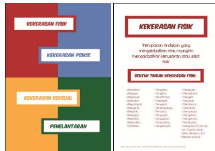
Gambar 4.15 Desain Konten Panduan

Buku panduan untuk orang tua memiliki warna yang selaras dengan buku cerita. Desain yang simpel merepresentasikan maksud buku yang langsung to-the-point . Namun, isi akan memiliki warna yang berbeda di setiap jenis pembahasan. Hal ini bertujuan untuk membedakan sehingga memudahkan pembaca untuk mengingat setiap jenis kekerasan tersebut.