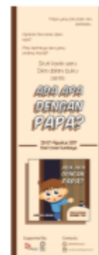
Gambar 4.16 Desain X-Banner