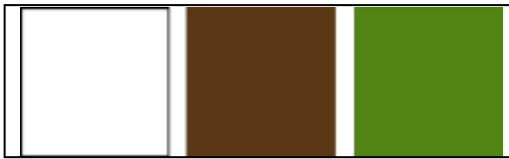
Gambar Keyword (Batik Tie Dye di Surabaya)

Warna utama adalah putih sebagai teks karena putih memiliki watak positif merangsang, cerdas, tegas serta melambangkan cahaya, kewanitaan. Warna kedua yaitu coklat melambangkan kearifan pengharapan agar masyarakat tidak melupakan Batik Tie Dye di Surabaya. warna ketigis hijau melambangkan alami, suatu yang hidup dan berkembang bertujuan bahwa Batik Tie Dye di Surabaya ini akan tetap hidup dan selalu berkembang.