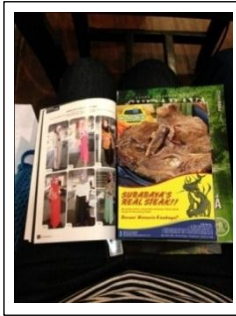
Gambar 7. Iklan Majalah Resto Kampoeng Steak (Mirani, 2013)