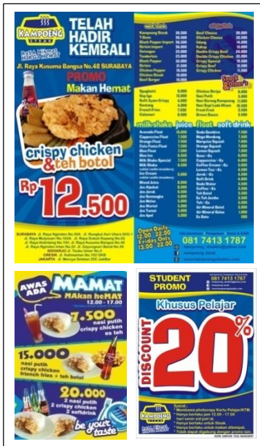
Gambar 1. Brosur Resto Kampoeng Steak (Mirani, 2013)