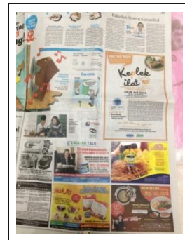
Gambar 6. Iklan Koran Resto Kampoeng Steak (Mirani, 2013)

kabar Jawa Pos karena surat kabar ini mencakup seluruh segmentasi pembaca yaitu dewasa maupun remaja. Surat kabar Jawa Pos edisi Surabaya beredar di daerah kota Surabaya dan Sekitarnya (Kab. Sidoarjo dan Gresik), terbit dengan tiga seksi utama. Pemasangan iklan resto Kampoeng Steak akan dipasang pada seksi Metropolis tepatnya pada halaman ‘Deteksi’. Iklan dipasang di tempat tersebut karena rubrik Deteksi merupakan halaman yang sering dibaca remaja. Sehingga remaja yang ingin membaca rubrik deteksi pasti akan melihat iklan KS terlebih dahulu. Iklan akan dipasang full colour dengan ukuran 2,5 kolom x 8cm (12cm x 8cm).