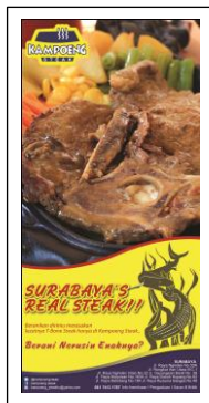
Gambar 5. Flyer Resto Kampoeng Steak (Mirani, 2013)

Sesuai dengan sketsa dan konsep yang telah terpilih, maka desain di implementasikan pada kertas ukuran 10cm x 21cm. Alasan pemilihan media ini karena memiliki jangka waktu yang lama, memungkinkan disebar dimana saja, mampu memberikan informasi tentang produk, biaya cetak murah, serta cakupan luas dan terarah karena diletakkan di tempat tertentu.