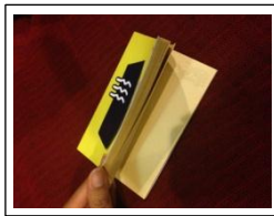
Gambar 8. Merchandise Notes Resto Kampoeng Steak (Mirani, 2013)