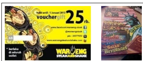
Gambar 2. Voucher Diskon dan Buku Menu Kompetitor (Mirani, 2013)

Untuk kompetitor resto Kampoeng Steak yang menawarkan menu steak dengan harga murah, maka dipilihlah Waroeng Steak and Shake dan American Grill Steak. Masing-masing dari para kompetitor Kampoeng Steak memposisikan produk yang sama dengan konsep yang hampir sama. Dengan konsep tempat makan yang menyediakan menu steak dengan harga terjangkau yang dapat dinikmati oleh berbagai kalangan dan mempunyai karakteristik khusus sebagai pembeda dengan yang lain.