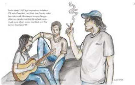
Gambar 12 Halaman 1 dan 2

Pada halaman ini hanya menjelaskan periode tahun yang akan di bahas pada halaman 3 hingga halaman 20. Menggunakan ilustrasi jaket jeans sebagai mana menyesuaikan dengan penampilan musisi balada di era 70-an.