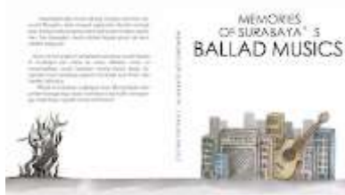
Gambar 7 Desain Layout Buku

Berikut adalah beberapa hasil implementasi karya buku ilustrasi sejarah musik balada di Surabaya.