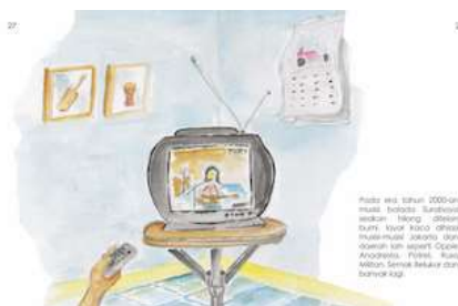
Gambar 26 Halaman 27 dan 28

Pada halaman ini menjelaskan tentang perkembangan musik balada semenjak mereka mulai merilis album dengan format LP dan tour Jawa – Bali.