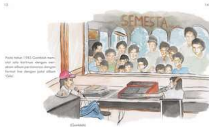
Gambar 18 Halaman 13 dan 14

Pada halaman ini menjelaskan ketika Franky keluar dari Gombloh and The Lemon Tree Anno '69 dengan berduet dengan adiknya Jane Sahilatua.