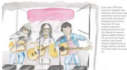
Gambar 13 Halaman 3 dan 4

Pada halaman ini adalah pengulasan tentang sejarah musik balada yang ada di Surabaya dengan menggunakan ilustrasi yang sama dengan cover dan halaman pembuka.