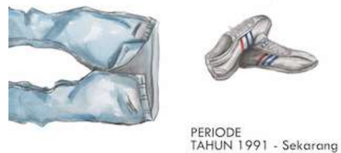
PERIODE TAHUN 1991 - Sekarang