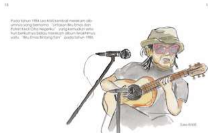
Gambar 19 Halaman 15 dan 16

Pada halaman ini menceritakan perkembangan Gombloh bersama Lemon Tree Anno '69 setelah berganti personel.