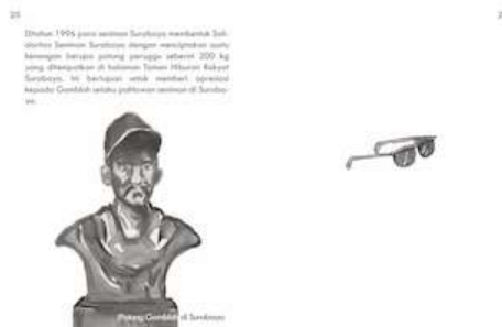
Gambar 25 Halaman 25 dan 26

Pada halaman ini menjelaskan perkembangan kembali musik balada di Surabaya dengan lahirnya musisi muda yang membawa udara segar bagi anak muda Surabaya.