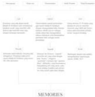
Gambar 2 Analisis Keyword

Pemilihan kata kunci atau keyword dari dasar penciptaan buku ilustrasi sejarah musik balada dari masa ke masa berbasis teknik aquarel sebagai upaya pengenalan kembali pada masyarakat Surabaya memerlukan sebuah strategi kreatif dalam penciptaan tampilan visualnya. Pesan visual merupakan sesuatu yang penting dalam sebuah ilustrasi cerita agar mampu menyampaikan pesan