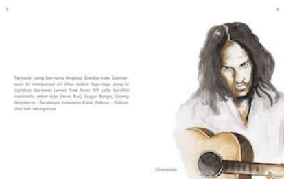
Gambar 14 Halaman 5 dan 6

Dihalaman ini merupakan informasi tentang awal perkembangan musik balada di Surabaya, dimana 3 orang pemuda sedang bermain musik yang kemudian membentuk sebuah grup musik yang menjadi pioner musik balada di Surabaya.