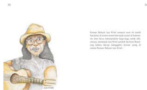
Gambar 29 Halaman 33 dan 34 Sumber : Hasil Olahan Penulis, 2016

Pada halaman ini menceritakan tentang keberadaan musik balada di