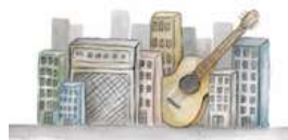
Gambar 8 Halaman Pembuka (Sumber : Hasil Olahan Penulis, 2016)

Pada halaman pembuka menggunakan gambar yang sama dengan cover dalam buku ini, yaitu ilustrasi perkotaan