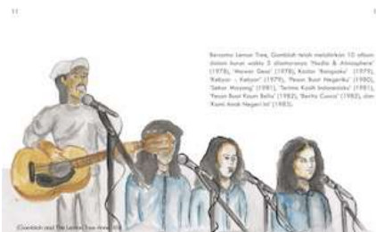
Gambar 17 Halaman 11 dan 12

Pada halaman ini menggambarkan sosok Leo Kristi pada awal beliau meniti solo karir setelah keluar dari Gombloh and The Lemon Tree Anno '69 dengan membentuk grup Konser Rakyat Leo Kristi.