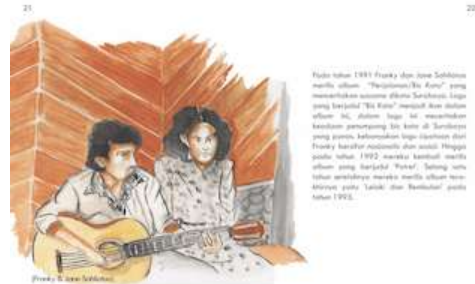
Gambar 22 Halaman 21 dan 22

Pada halaman ini menjelaskan tentang karir solo Gombloh yang melejit dengan hits dilagunya yang sangat fenomenal hingga wafatnya beliau pada tahun 1988.