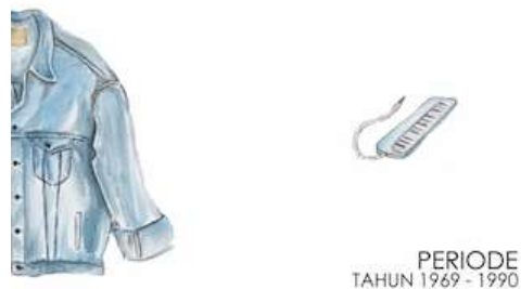
Gambar 11 Halaman Periode Tahun 1969 - 1990 Sumber : Hasil Olahan Penulis, 2016

Halaman selanjutnya adalah halaman iii dan iv merupakan halaman pengantar yang berisi penjelasan singkat mengenai buku ilustrasi sejarah musik balada ono dan halaman selanjutnya adalah daftar isi buku ini.