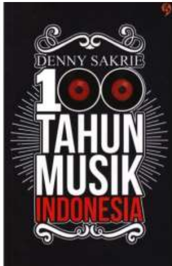
Gambar 1 Buku 100 Tahun Musik Indonesia (Cover) (Sumber : Hasil Olahan Peneliti 2015)