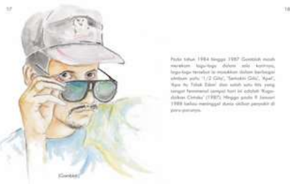
Gambar 20 Halaman 17 dan 18

Pada halaman ini menceritakan perjalanan Gombloh bersolo karir dengan ilustrasi proses rekaman di salah satu label di Surabaya.