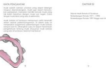
Gambar 10 Halaman iii dan iv

Pada Halaman I dan ii berisi informasi tentang hak cipta penulis dan desainer dari buku ilustrasi sejarah musik balada di Surabaya ini. Halaman selanjutnya berisi ucapan terima kasih kepada nara sumber, dan semua pihak yang telah membantu dalam pembuatan buku ilustrasi sejarah musik balada ini.