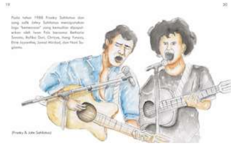
Gambar 21 Halaman 19 dan 20 Sumber : Hasil Olahan Penulis, 2016

Pada halaman ini menjelaskan tentang album baru yang di rilis oleh Leo Kristi pada tahun 1984.