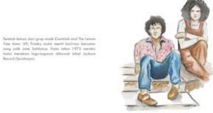
Gambar 16 Halaman 9 dan 10

Dalam halaman ini menjelaskan musisi yang bernama asli Soedjarwoto Soemarsono atau yang biasa di panggil Gombloh tentang karakter musik yang beliau mainkan.