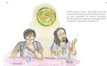
Gambar 27 Halaman 29 dan 30

Surabaya pada era 2000-an yang sempat menghilang semenjak Franky Sahilatua dan Leo Kristi meninggalkan kota Surabaya.