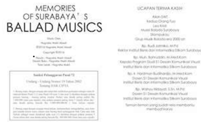
Gambar 9 Halaman i dan ii

Pada halaman pembuka menggunakan gambar yang sama dengan cover dalam buku ini, yaitu ilustrasi perkotaan